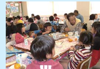
地域の方と一緒に給食(南小)