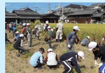
稲刈り体験(三碓小)