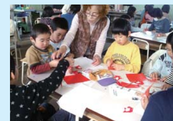
折り紙教室(三碓小)