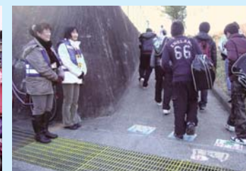
あいさつ運動・登校指導(南中)