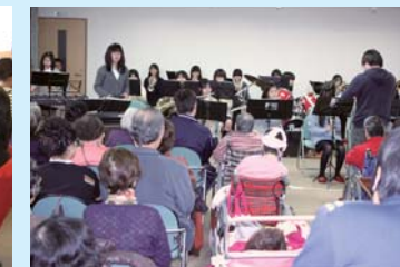
地域へ慰問に(南中)