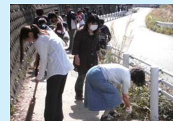
地域の清掃活動(南中)