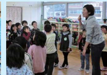
キッズイングリッシュ(南幼)